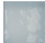
E235963 Light Blue