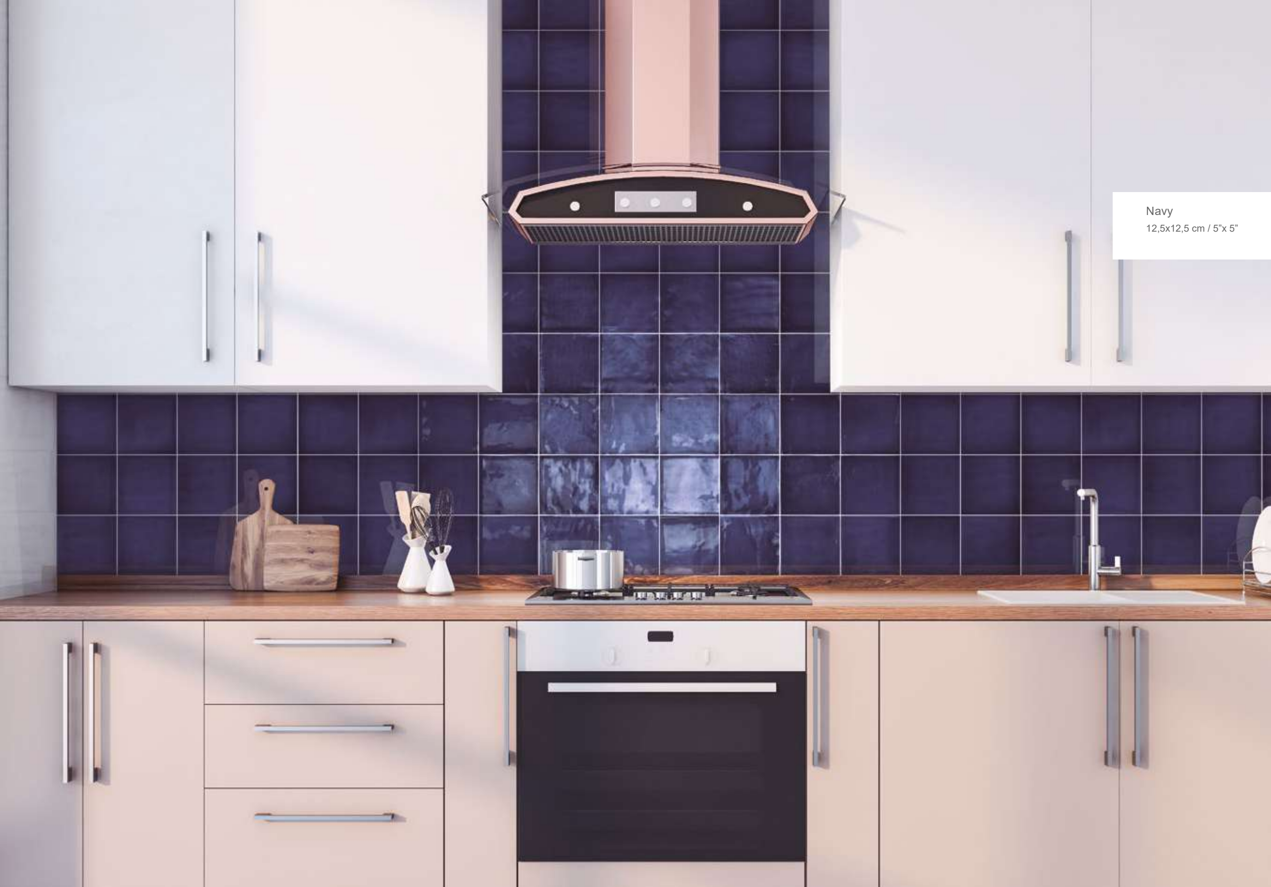
Navy 12,5x12,5 cm / 5"x 5"